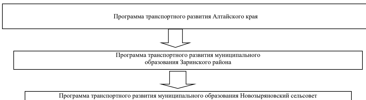
Рис. № 1 Система взаимосвязи программ транспортного развития

Программа является важнейшим элементом многоуровневой системы стратегического планирования в МО Новозырянский сельсовет Заринского района Алтайского края в основу, которой положены современные управленческие механизмы реализации, системная и последовательная модернизация МО Новозырянский сельсовет Заринского района Алтайского края (рис. 1).