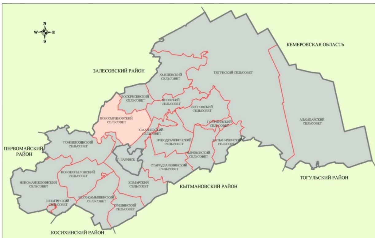
Рис. 2. Местоположение муниципального образования

Общая площадь муниципального образования по данным ЕГРН 23951,2 га, что составляет 4,7% от территории Заринского района. Связь с районным и краевым центром осуществляется по автомобильным дорогам регионального и межмуниципального значения. Дата образования с. Новозыряново 1803 г., с. Старокопылово 1734 г., п. Широкий Луг 1917 г.